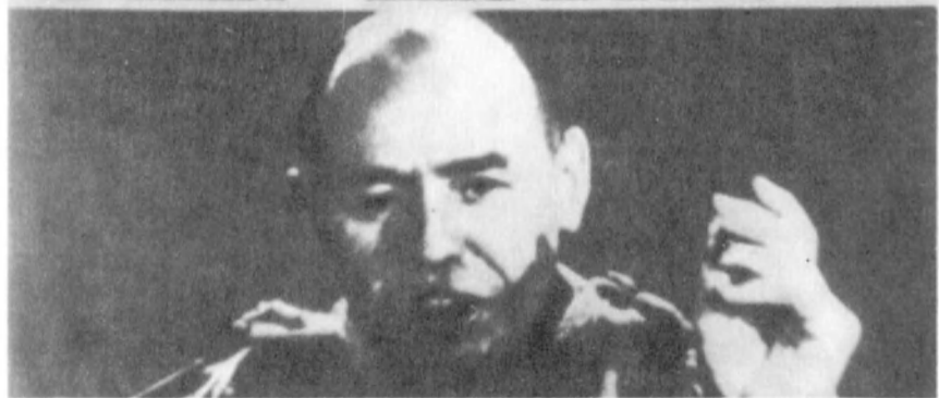
Кадры из фильма «Смеющийся человек»