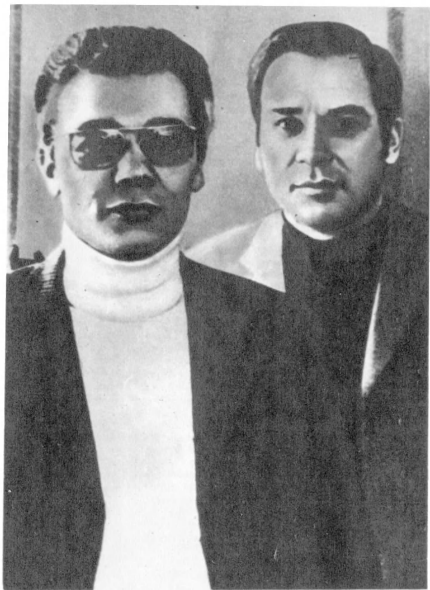
Документалисты ГДР Вальтер Хайновский и Герхард Шойман