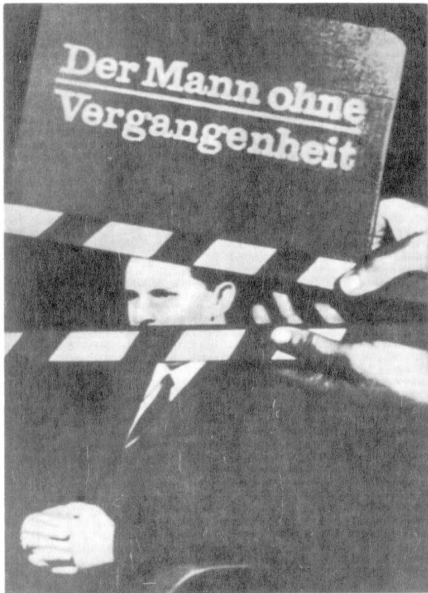
На съемках фильма «Человек без прошлого»