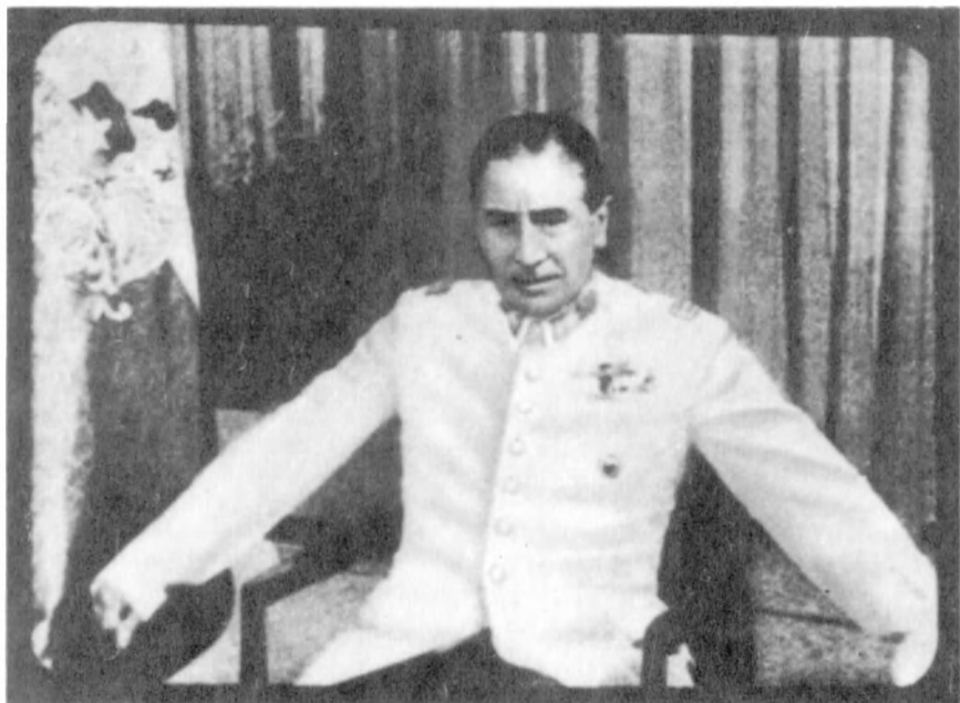
Кадр из чилийского цикла В. Хайновского и Г. Шоймана

дификации и трансформации, и с точки зрения развития выразительных возможностей документального фильма.