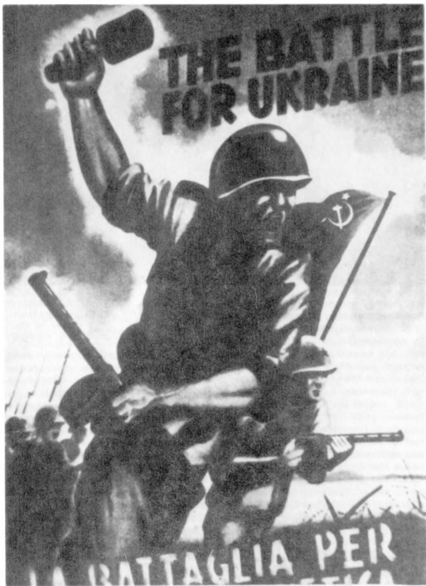
Плакат, посвященный фильму А. Довженко «Битва за нашу Советскую Украину»