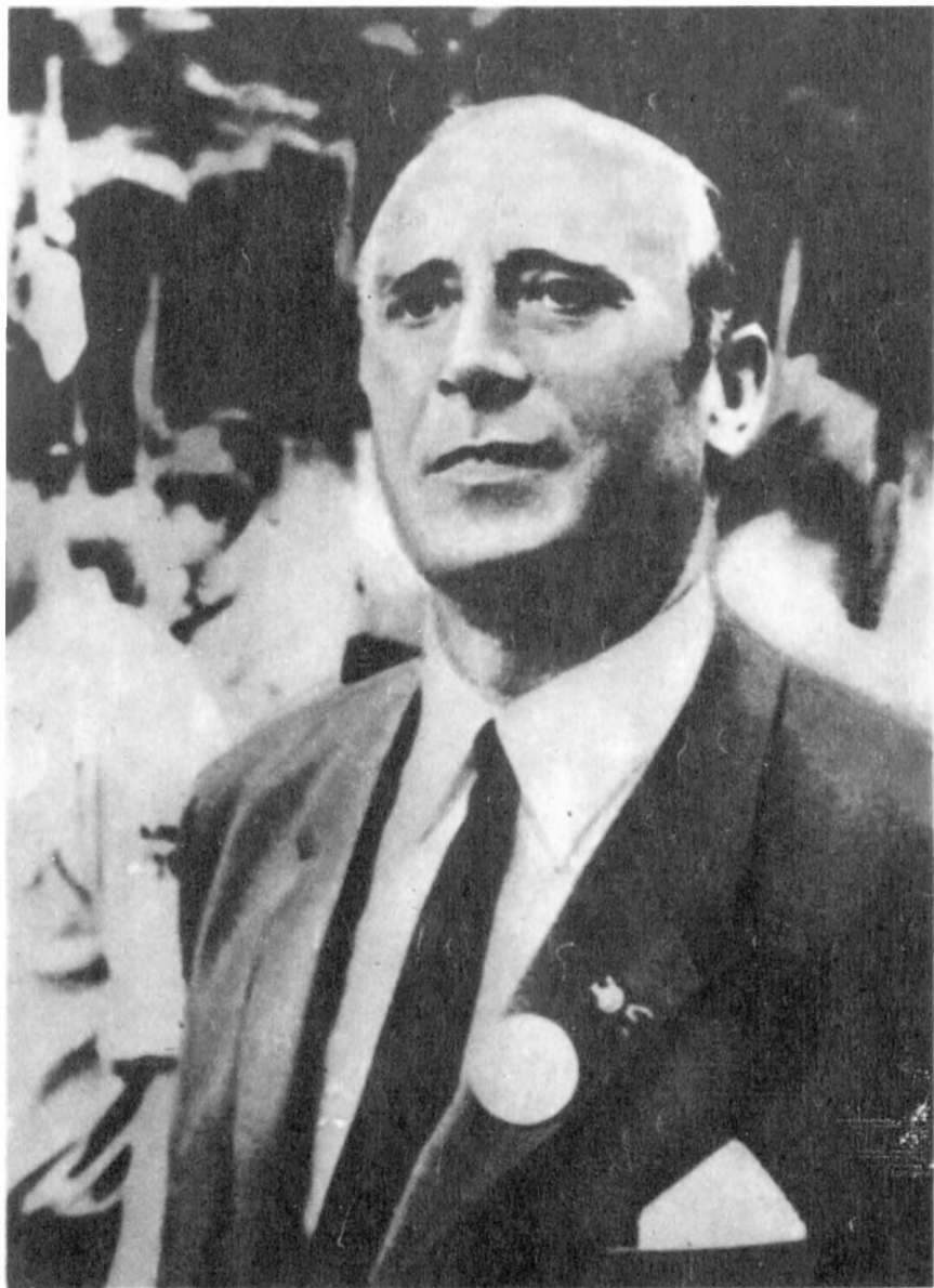
Кадр из фильма «Президент в изгнании»